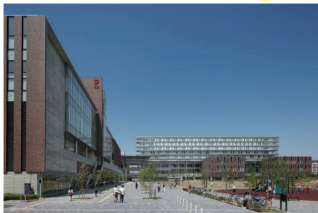
立命館大学大阪いばらきキャンパス(2015年4月開設)

*大会での勝敗に応じて付与され、個人の実績として累積される。米国の大学で高く評価されている米国NFLの「グローバルポイント」としてもカウントされるため、日本から米国の大学に進学を希望する際、アピール材料とすることができる。